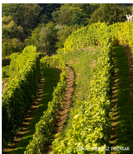
SLIKA: TADEUSZ POŹNIAK