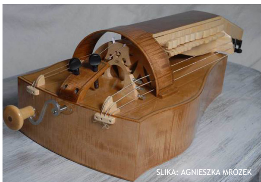
SLIKA: AGNIESZKA MROZEK