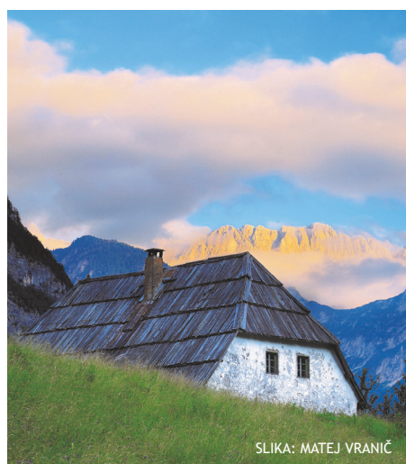
SLIKA: MATEJ VRANIČ