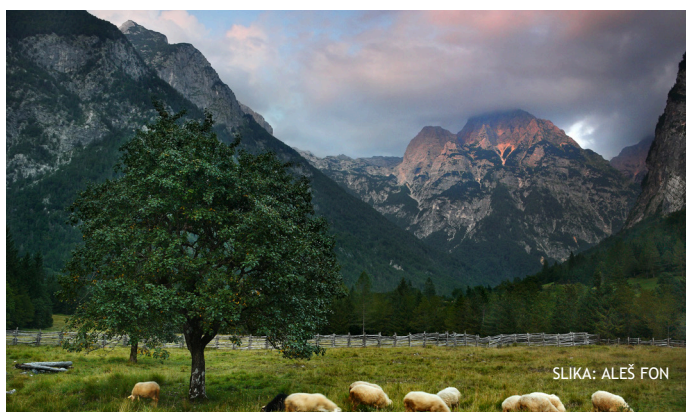
SLIKA: ALEŠ FON