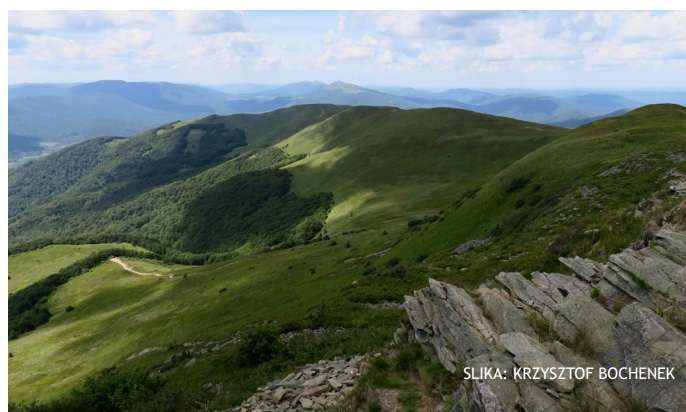
SLIKA: KRZYSZTOF BOCHENEK